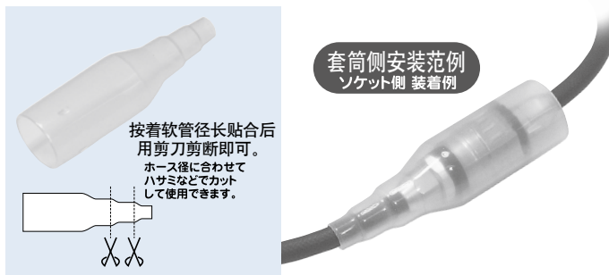
套筒侧安装范例 / ソケット側 装着例