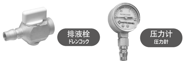
排液栓 / ドレンコック